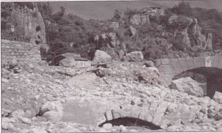
L'entrée du béal réapparaît.

La crue de mardi dernier n'a pas eu que des effets négatifs. Les amoureux du patrimoine ancien ont eu l'heureuse surprise de redécouvrir l'entrée du "béal" de Labeaume. Cette en-